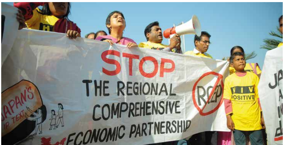
Bild: Mitglieder der Medikamentenkampagne bei den Protesten gegen die RCEP in Indien