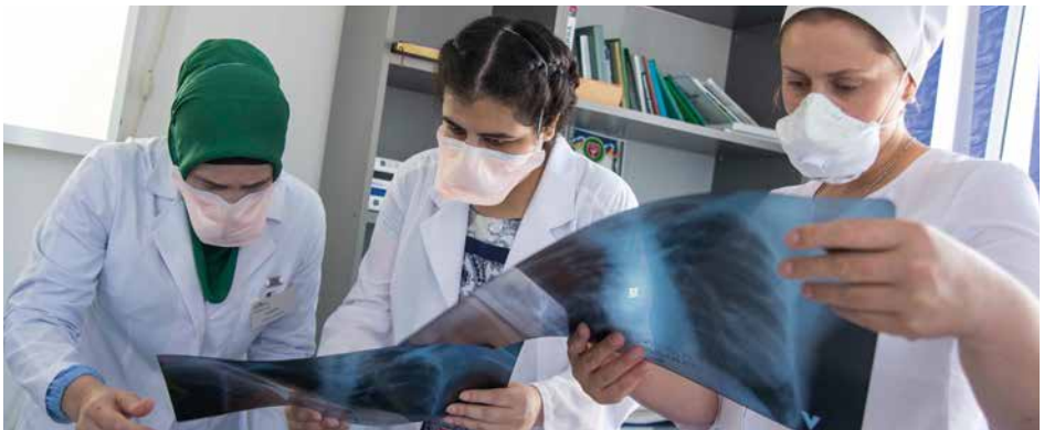
Bild: In der Russischen Föderation betrachten Mitarbeiterinnen von Ärzten ohne Grenzen und des russischen Gesundheitsministeriums Röntgenbilder eines TB-Patienten.