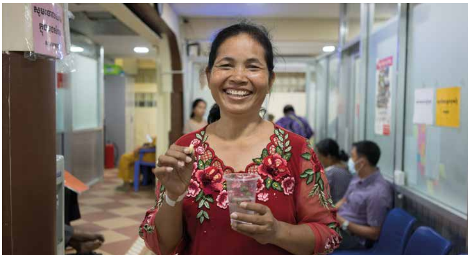
Bild: Eine Patientin erhält Medikamente zur Behandlung von Hepatitis C im Projekt von Ärzten ohne Grenzen in Phnom Penh, Kambodscha.